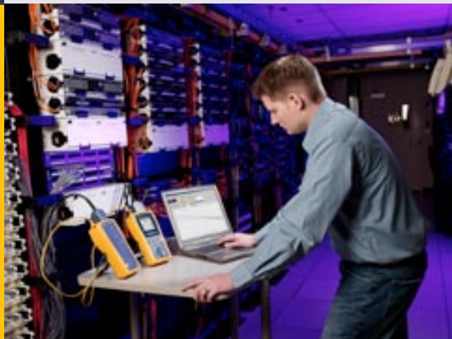
DTX-1800 con kit DTX 10 Gig para comprobación del rendimiento de "Alien Crosstalk"

Amplíe las prestaciones del DTX CableAnalyzer™ para poder comprobar sistemas de cableado coaxial tanto de datos (como Ethernet 10BASE-2 o 10BASE-5) como de distribución de vídeo. Compruebe la longitud, el retardo de propagación, la impedancia (de entrada) y las pérdidas en función de la frecuencia de la señal en cableado coaxial.